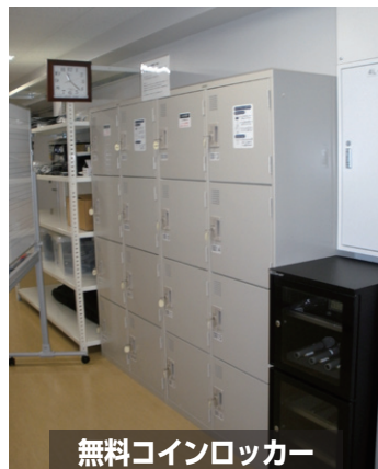
無料コインロッカー

舞台裏を通り、上手下手それぞれに移動できます。 通路にはエアコン・無料コインロッカーも設置されています。