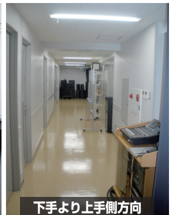
下手より上手側方向