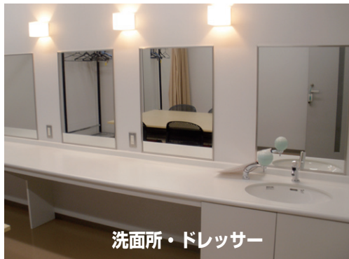
洗面所・ドレッサー